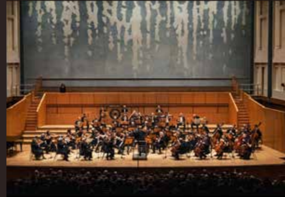
@ Γιώργος Χρυσοχοϊδης